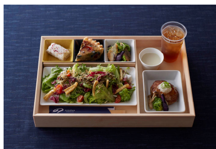
FOOD セットメニューの一例 (メインディッシュ+サラダ+2デリ膳) ※ドリンクは含みません